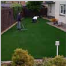
Controleren of het gras netjes en spanningsloos ligt