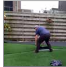
Banen goed sluitend tegen elkaar leggen