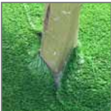
Tip: insnijden van obstakels