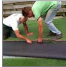
Zijkanten van het gras eraf snijden