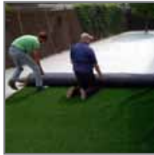
Uitrollen in de tuin (denk om de goede poolrichting!)