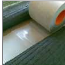
QuickSeam Tape uitrollen en dunne folie eraf halen