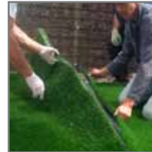
Het gras terug klappen en de naad aandrukken