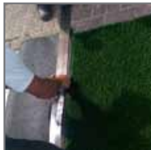
Tip: recht snijden langs een metalen lat