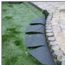
Tip: insnijden van rondingen om spanning eraf te halen