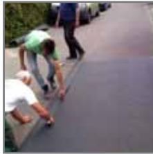
Opmeten en banen snijden (bij een groot gazon)