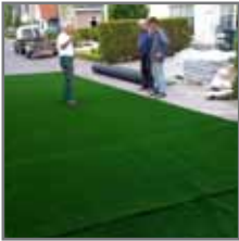
Uitrollen (waar voldoende ruimte is om te snijden)