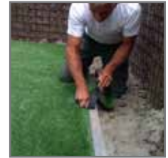
Het gras rondom op maat snijden